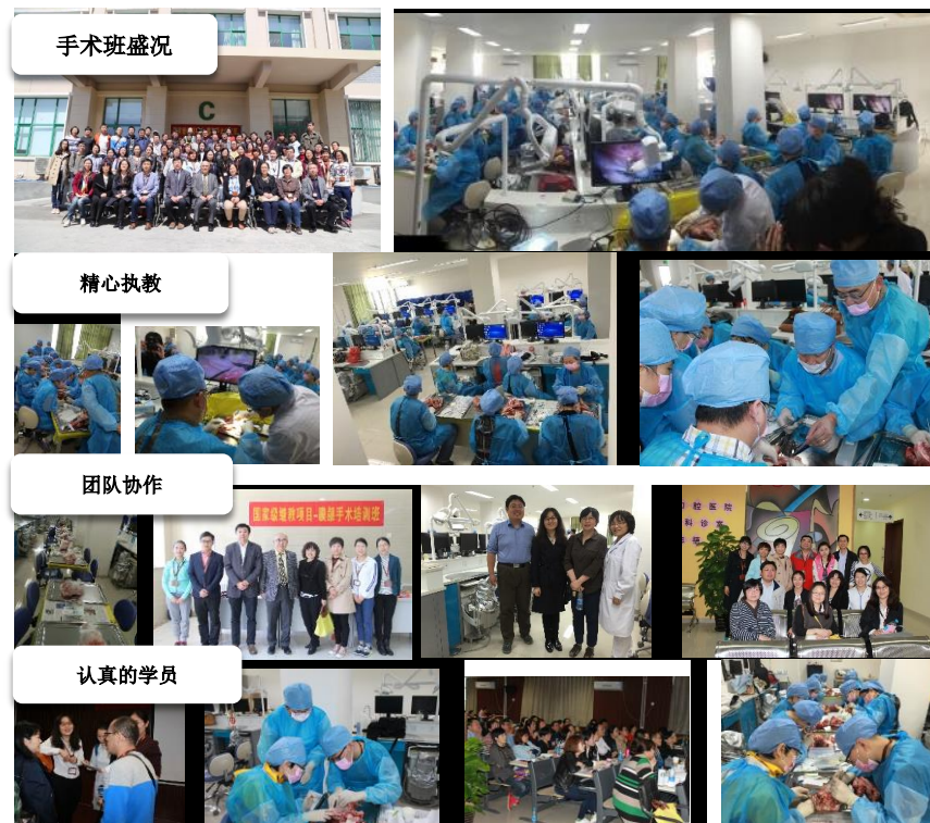
第一期膜龈手术班的情况